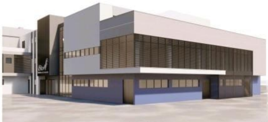
Imagen Render Obra terminada

Se tiene previsto la recepción final en julio de este año.