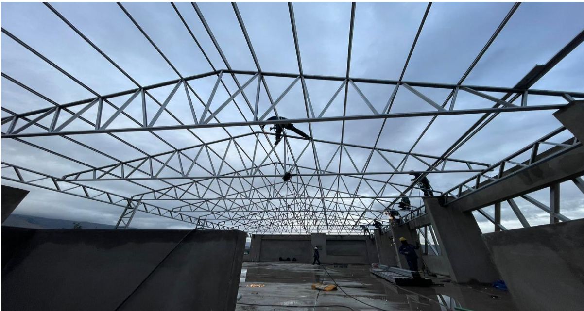
Foto Avance a la fecha 15/03/2023

La puesta en marcha del Hangar de mantenimiento, conllevará cambios en la Gerencia de Mantenimiento como también la necesidad de personal para atender y en un futuro brindar este servicio a terceros.